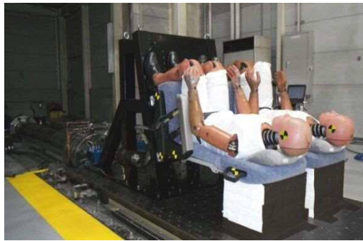
水中衝突とリバウンドによる着水衝撃を考慮した上下方向の衝突模擬試験