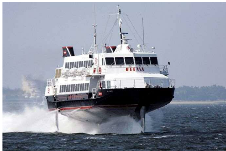
福岡と釜山を結ぶ高速水中翼船「ビートル」

タカタでは、今回の高速水中翼船専用シートベルトの開発を通して、これからもあらゆる安全分野において貢献できるよう取り組んでまいります。