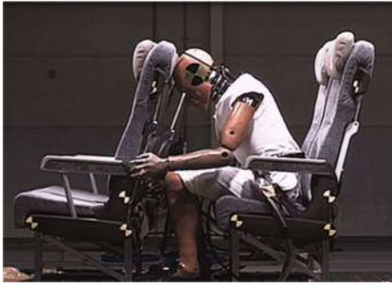
前方衝突模擬試験